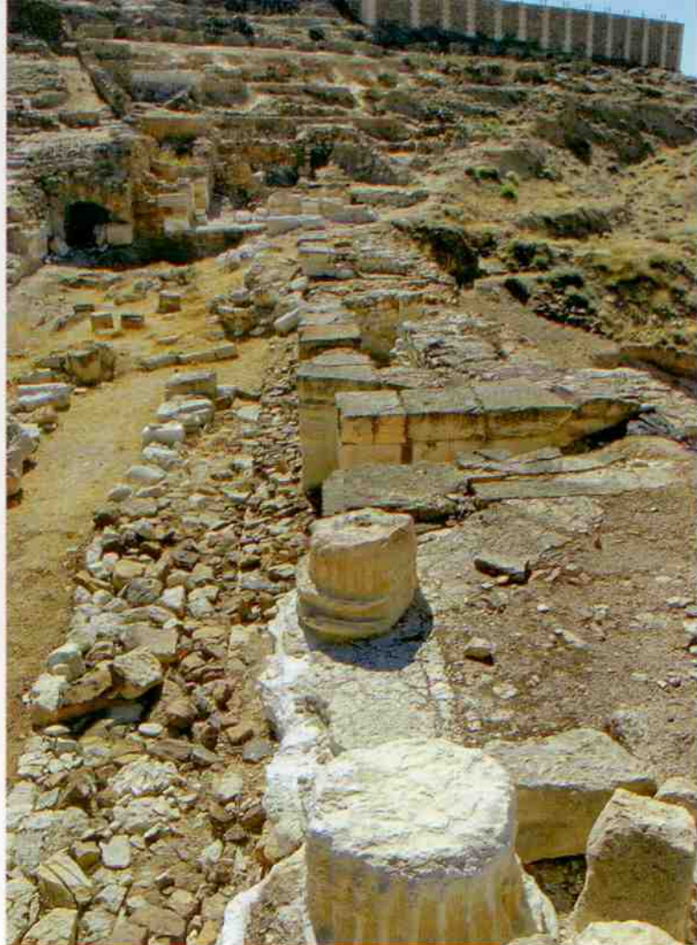
Arriba, un detalle del yacimiento celtibero-romano de Bilbilis Augusta.

tranquilos, van a seguir en pie por muchos siglos más. A pocos pasos se llega a la zona del conjunto fortificado islámico, y coronando el antiguo barrio judío se alza el castillo de Doña Martina . Al bajar desde el castillo mayor, el de Ayyub, el que ofrece las mejores vistas, se cruza la morería, señalizada con azulejos con el dibujo de la media luna. La cruz es para el barrio cristiano y con la estrella se indican las calles de la judería, donde aún quedan las puertas de acceso a la antigua sinagoga Mayor.