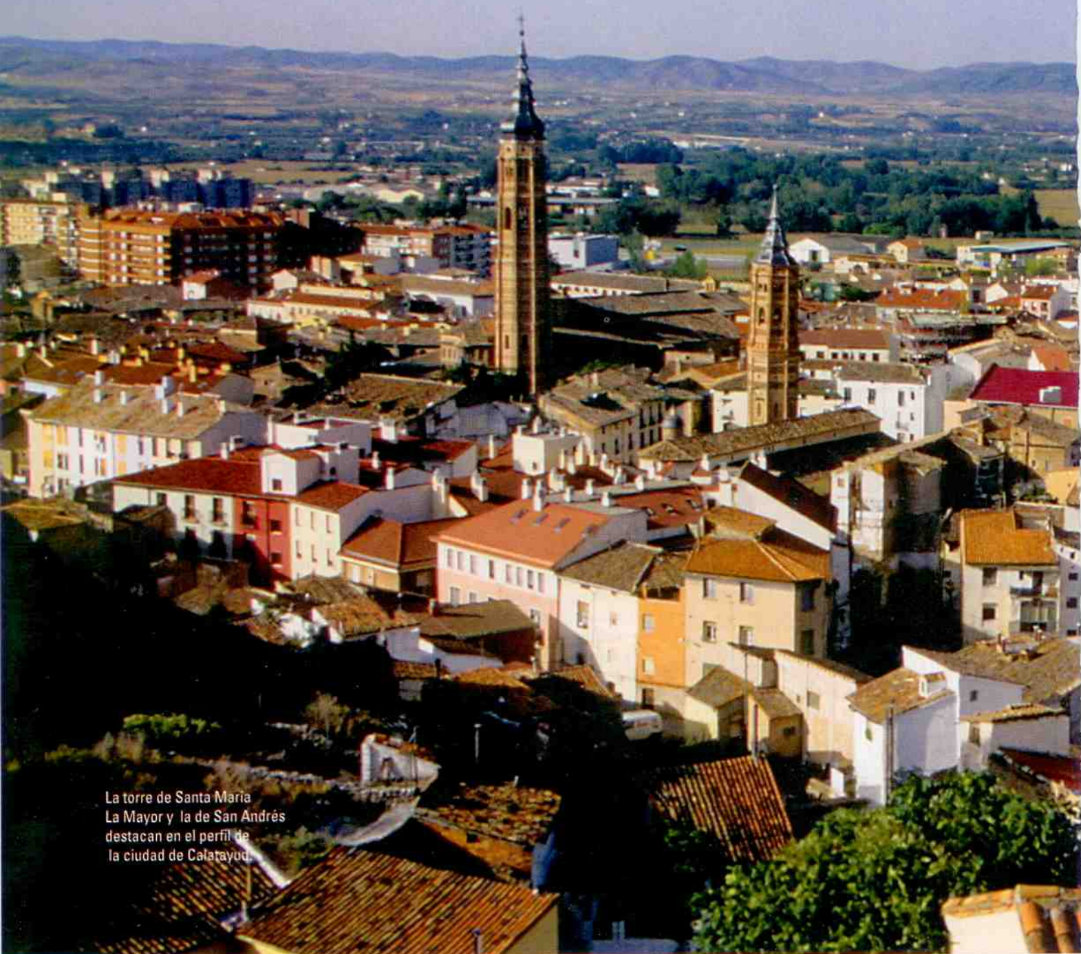
La torre de Santa María La Mayor y la de San Andrés destacan en el perfil de la ciudad de Calatayud.

Las torres mudéjares de Calatayud, altivas y elegantes, dibujan un perfil inconfundible. De aquí arranca una hermosa ruta surcada por ríos, valles y reconfortantes aguas termales. texto: A. Hernández