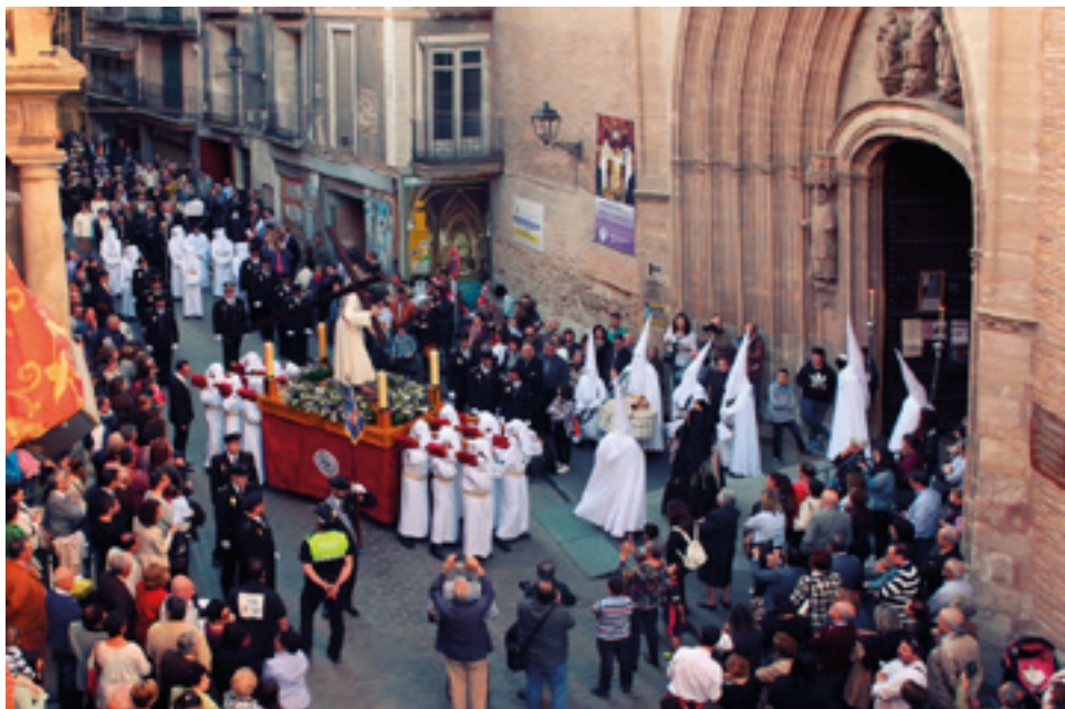
Fotografía: Archivo de la Hermandad

Antes de entrar en San Pedro, se cantan dos jotas cofrades. En el interior se realiza la Estación de Penitencia y se canta otra jota cofrade tras el saludo a Ntra Señora de la Esperanza. A la salida de San Pedro, Nuestro Cristo recibe una petalada desde los balcones del casino. El CNP acompaña y escolta a nuestro sagrado titular durante toda la procesión.