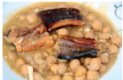
Garbanzos con congrio

Acabamos este periplo con otro producto de pastelería: las monas de Pascua -seguramente será una tradición importada de cercanas regiones- artísticas figuras de chocolate, generalmente huevos, que los padrinos regalan a sus ahijados. Deliciosas, y es que no hay que olvidar que el primer chocolate que llegó a este viejo continente vino a parar al cercano Monasterio de Piedra.